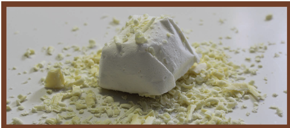
Tartufo Cioblanc gelato al cioccolato bianco con cuore di cioccolato bianco disponibile anche con variegatura di caramello