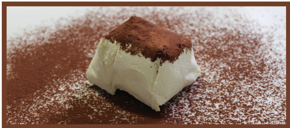
Tartufo Tiramisù Gelato al tiramisù con cuore morbido di cioccolato fondente