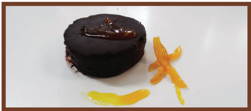
Tortino di gelato al cioccolato fondente variegato all'arancia o all'albicocca