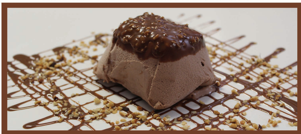
Tartufo Rocher Gelato al Rocher con cuore morbido di cioccolato fondente