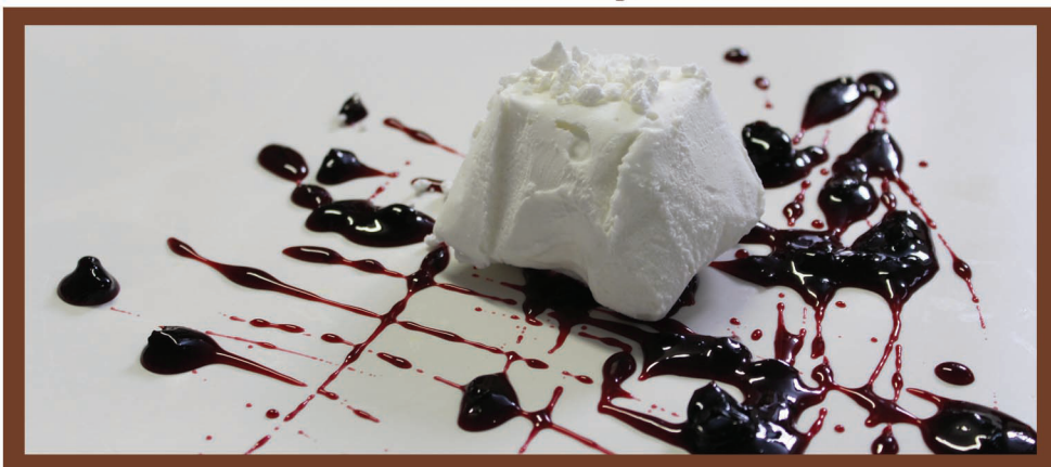
Tartufo Bianco Gelato al fiordilatte con cuore di amarena