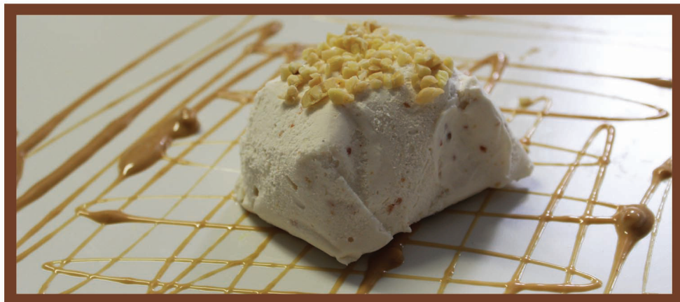
Tartufo Mandorla Gelato alla mandorla con cuore di mandorla pralinata