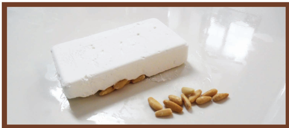
Mattonella ai Pinoli