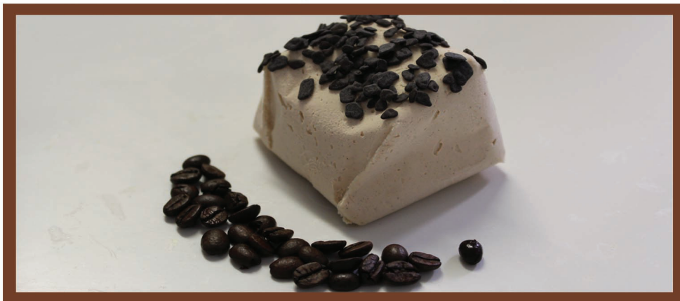
Tartufo Caffè Gelato al caffè con cuore di panna montata