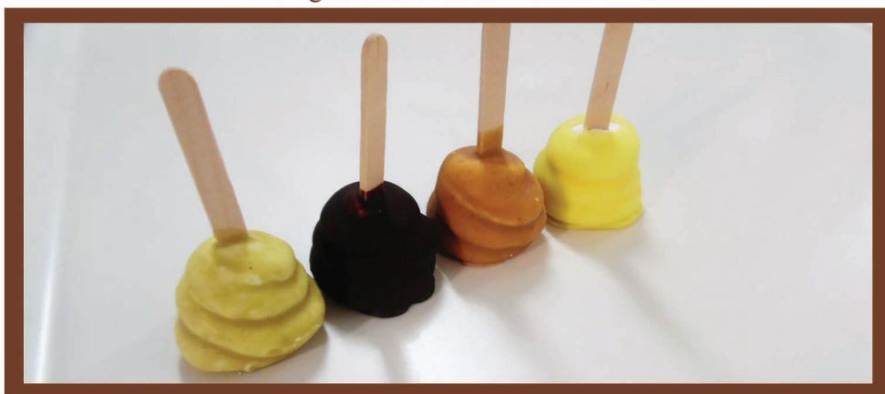
Golose mini porzioni di semifreddi disponibili in vari gusti